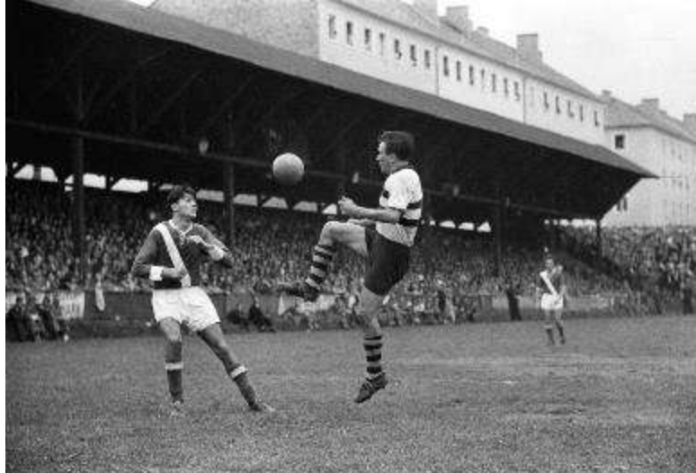
SK Sturm Graz